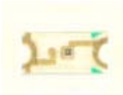
Kuva 3. LEDit

Kuvassa 3. esitetään kortille asennettavien LEDien kotelo ja niiden napaisuus. LEDit ovat kaikki saman värisiä, punaisia. LEDin väri ei näy mitenkään kotelosta. LEDin värin voit testata esim. noin 3...5 V jännitteellä ja noin 1 k \Omega vastuksella. Älä ylitä 5 V jännitettä !