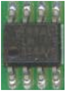
Kuva 2. Mikropiirit

Kuvassa 2. on pintaliitostekniikassa käytetty mikropiiri. Mikropiirin kotelotyyppi on SO-8. Kirjain-lyhenne SO tulee sanoista Small Outline Package ja perässä oleva numero tarkoittaa kotelossa olevien liitäntäjalkojen määrää. Kytkennässä ATtiny2313-20SI on SO-20 tyyppiä.