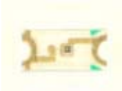
Kuva 3. LEDit

Kuvassa 3. esitetään kortille asennettavien LEDien kotelo ja niiden napaisuus. LEDit ovat kaikki saman värisiä, punaisia. LEDin väri ei näy mitenkään kotelosta. LEDin värin voit testata esim. noin 3...5 V jännitteellä ja noin 1 k \Omega vastuksella. Älä ylitä 5 V jännitettä !